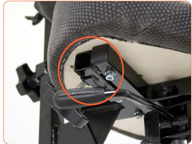
[Anbringung von Armlehnen möglich]

Der REAL Stehstuhl ist mit einer breiten Palette an Zubehör- und Zusatzoptionen erhältlich. Dabei steht eine Auswahl an Sattelsitzen, Rückenlehnen, Armlehnen und anderem Zubehör zur Verfügung.