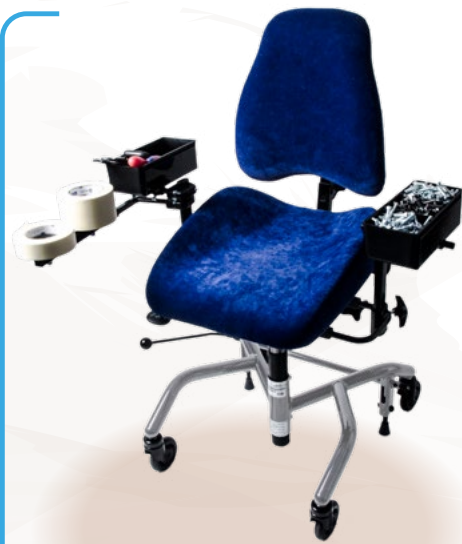
REAL® 7000 PLUS MONTERINGSSTOL