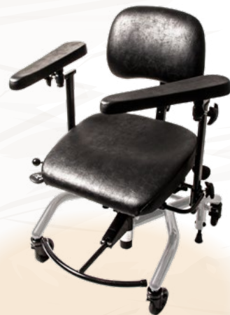
REAL® 7000 PLUS SVETSSTOL