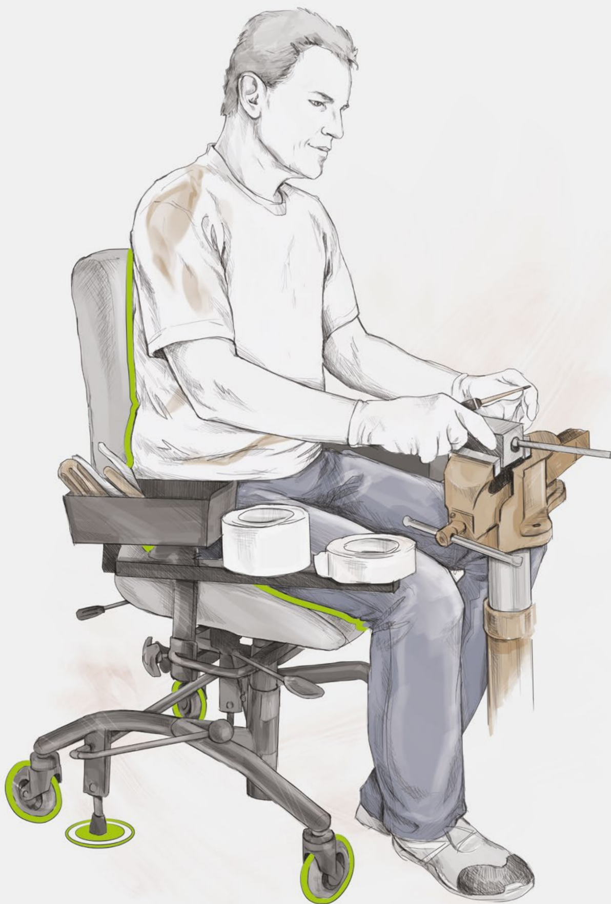
REAL® 7000 PLUS MONTERINGSSTOL