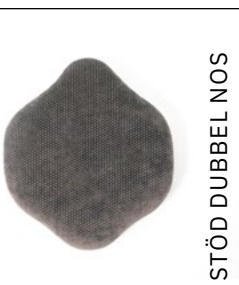
STÖD DUBBEL NOS