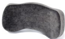
RYGG EM PLUS