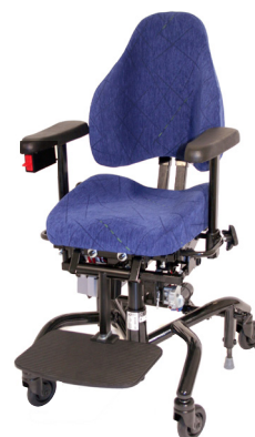
⊕ REAL® 9000 PLUS KIND EL