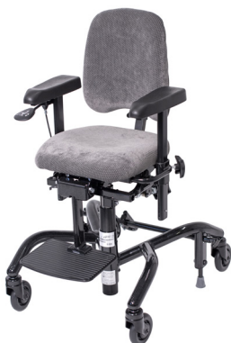
⊕ REAL® 9000 PLUS KIND

Der real 9000 plus kind wurde vom Schwedischen Technischen Forschungsinstitut SP getestet und gemäß DIN-EN 1335, 1–3 zugelassen. Zudem besitzt der Stuhl die CE-Kennzeichnung und erfüllt die schwedischen Anforderungen an medizintechnische Produkte sowie die des schwedischen Staatlichen Amtes für Arzneimittelwesen. Die hohen Qualitätsanforderungen gewährleisten zudem jahrelange Sicherheit im Gebrauch.