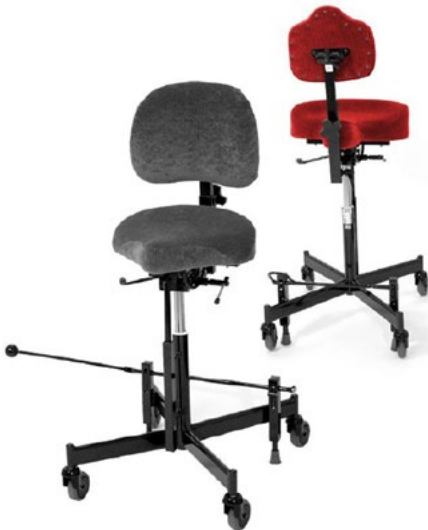
REAL 2015 und 2624