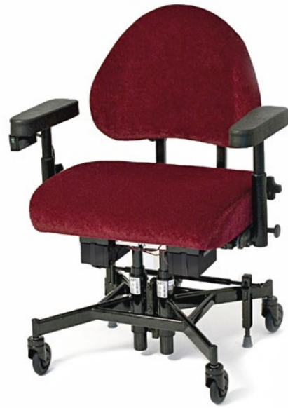
REAL 9200 TWIN XXL EL bis zu 275 kg

Der elektrisch betriebene REAL 9200 TWIN EL bietet eine Hubhöhe von 28 cm. Er ist für ein Nutzergewicht bis zu 275 kg konzipiert. Der manuell betriebene REAL 9200 TWIN bietet eine Sitzhöhenverstellung von 20 cm und unterstützt ein Nutzergewicht von bis zu 180 kg.