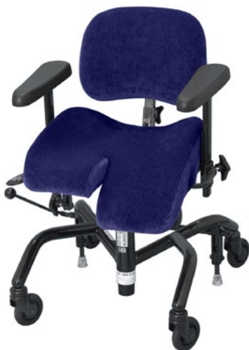
REAL 9000 PLUS ARTHRODESE HMV.-Nr. 26.46.02.0015

Dieses Sitzpolster besteht aus zwei getrennt voneinander verstellbaren Teilen für ergonomisches und bequemes Sitzen trotz Bewegungseinschränkung in der Hüfte oder im Kniegelenk. Eine Bewegungseinschränkung kann durch Gelenkeinschränkung oder Muskelspannung (Spasmen) entstehen.