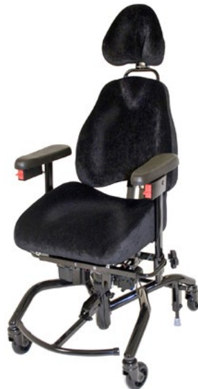
REAL 9000 PLUS EL

hat neben seiner elektrischen Höheneinstellung und standfesten Bremse eine elektrische Sitzwinkelverstellung um das Aufstehen zu erleichtern.