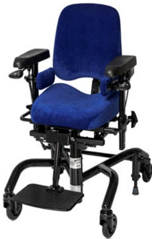
REAL 9000 PLUS KIND HMV.-Nr. 26.11.05.0040