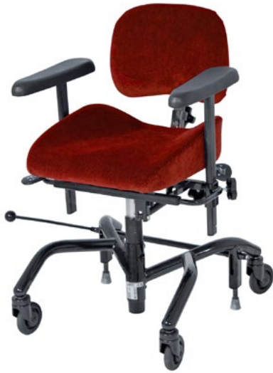
REAL 9000 PLUS