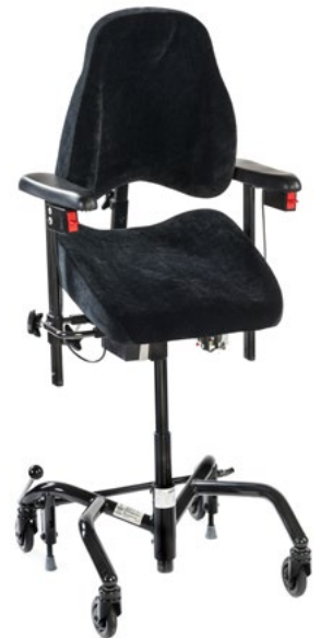
REAL 9000 PLUS EL AUFSTEHHILFE