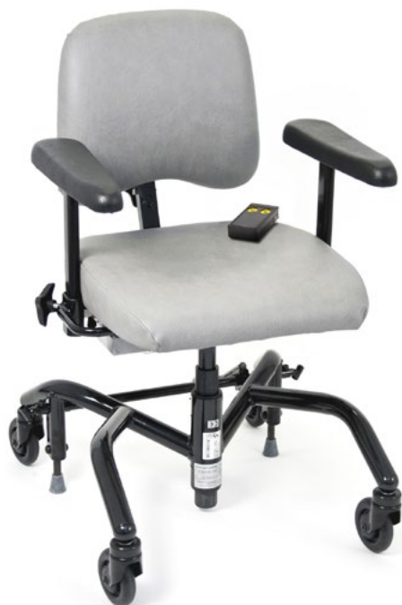
[stol på bilden är utrustad med PLUS-stativ klinik 48x53cm]