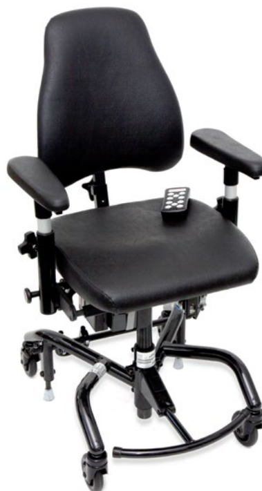
[stol på bilden är utrustad med PLUS-stativ klinik 43x53cm]