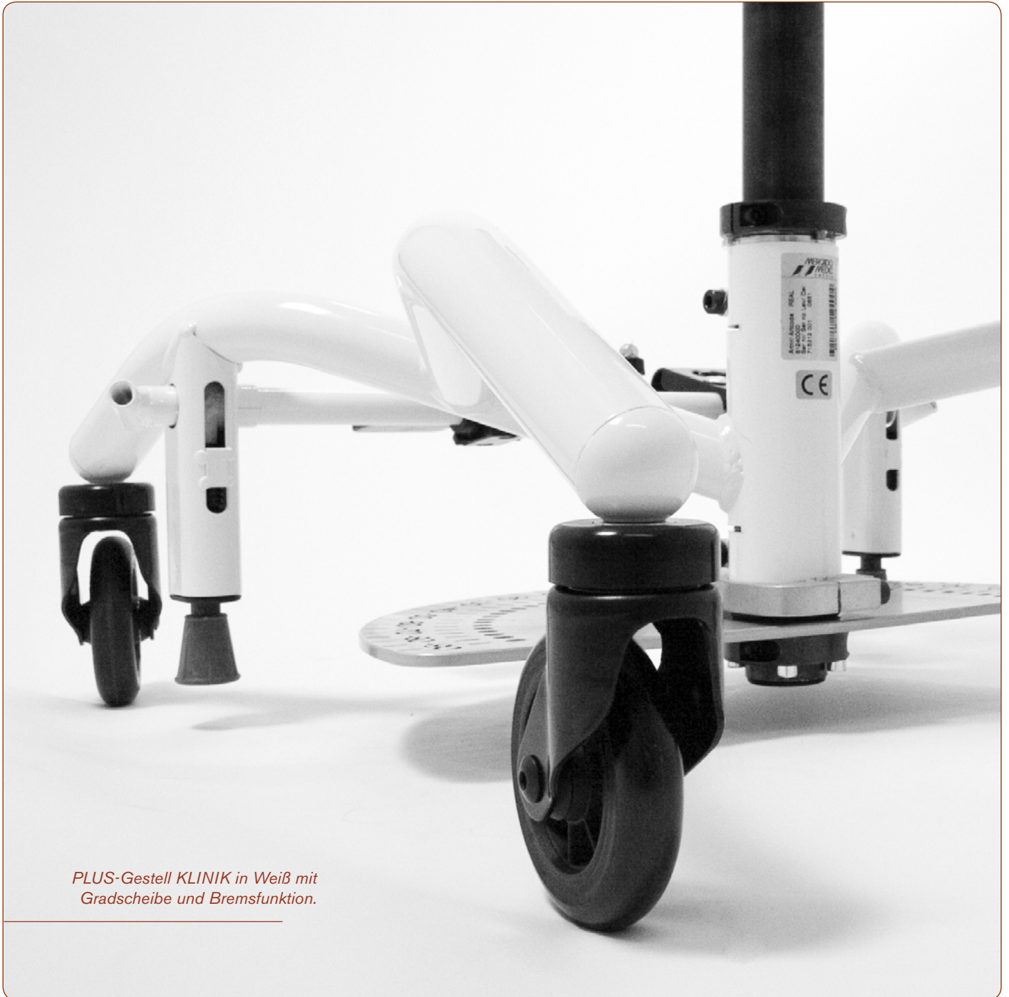
PLUS-Gestell KLINIK in Weiß mit Gradscheibe und Bremsfunktion.