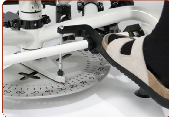
Gradscheibe und Bremse werden mit dem Fuß betätigt.