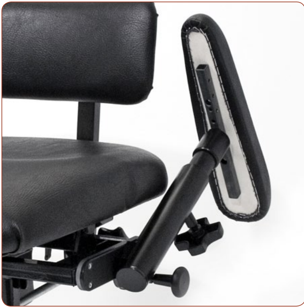
Klappbare Armlehnen für einfaches Umsetzen zur Seite.