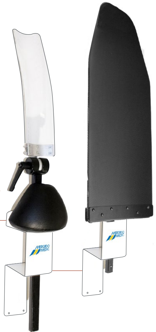
Wandhalterungen für nicht angebrachte Rückenlehnen.