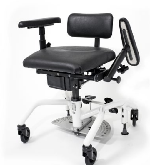
Niedrige Rückenlehne 33 x 16 cm (Standard).