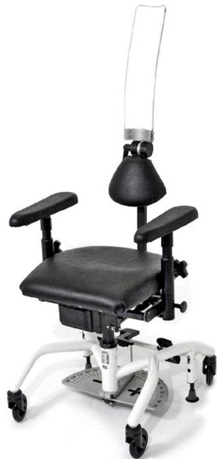
Rückenlehne mit Nackenstütze aus Makrolon (Standard).