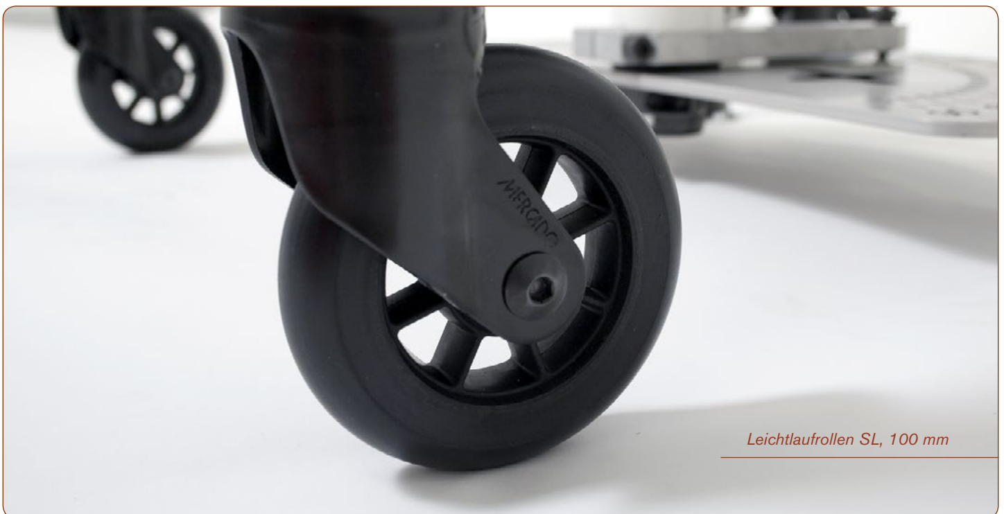
Leichtlaufrollen SL, 100 mm