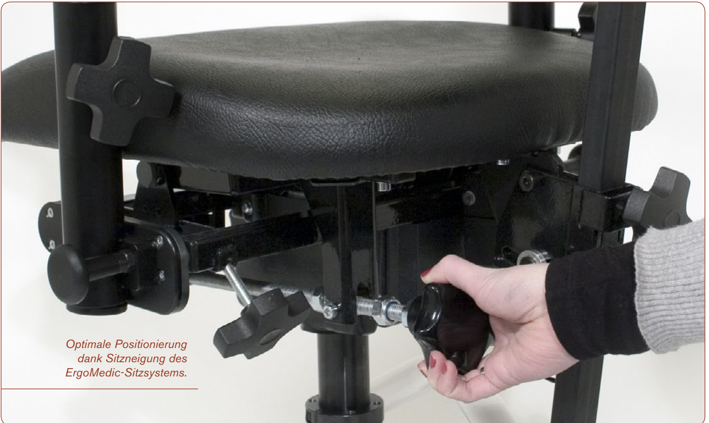
Optimale Positionierung dank Sitzneigung des ErgoMedic-Sitzsystems.

Mit Hilfe der Sitzneigung (nach vorn und hinten verstellbar) lässt sich die richtige Position für den Patienten einfach finden.