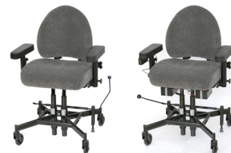
REAL 9200 REAL 9200 EL